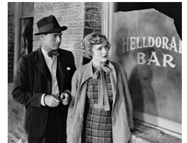
1935 HELLDORADO (Hellorado) de James Cruze avec Richard Arlen