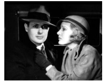
1933 LES AMANTS FUGITIFS (Fugitive Lovers) de Richard Boleslawski avec R. Montgomery