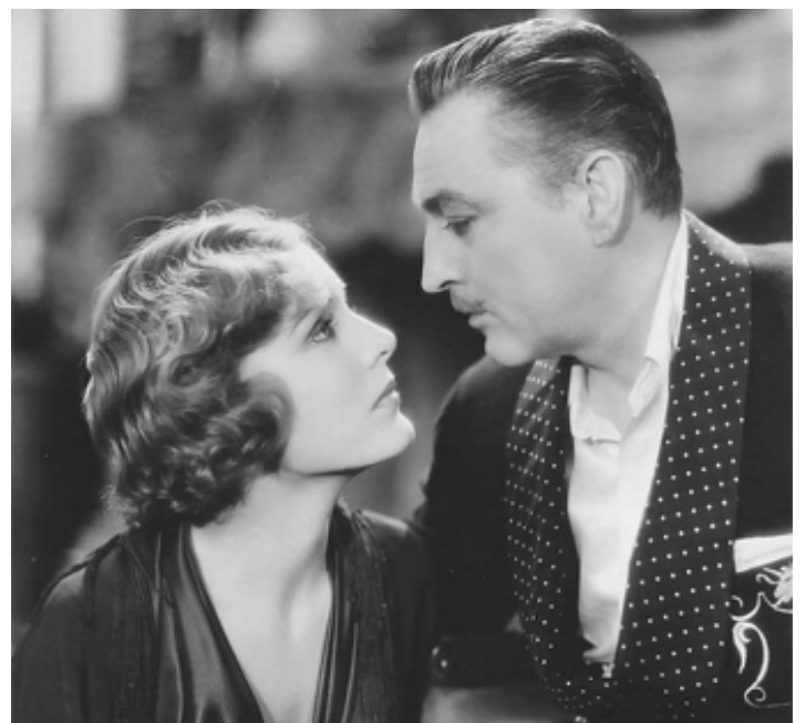
1933 LES INVITÉS DE HUIT HEURES (Dinner at eight) de George Cukor avec John Barrymore