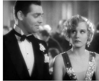
1931 PUR SANG (Sporting Blood) de Charles Brabin avec Clark Gable