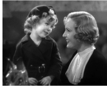
1934 LE MINISTÈRE DES AMUSEMENTS (Stand up and cheer) d'H. McFadden avec Shirley Temple