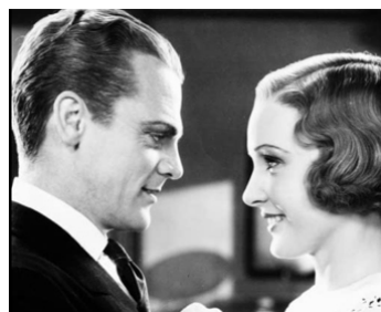
1933 LE BATAILLON DES SANS-AMOUR (The Mayor of Hell) d'A. Mayo avec James Cagney