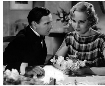
1933 DAY OF RECKONING de Charles Brabin avec Conway Tearle