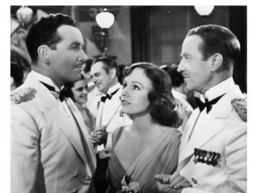
1938 ARMY GIRL de George Nichols Jr avec Preston Foster, H. B. Warner