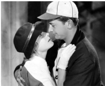
1934 DEATH OF THE DIAMOND d'Edward Sedgwick avec Robert Young