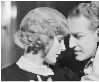
1933 BEAUTÉ À VENDRE (Beauty for sale) de Richard Boleslawski avec Otto Kruger