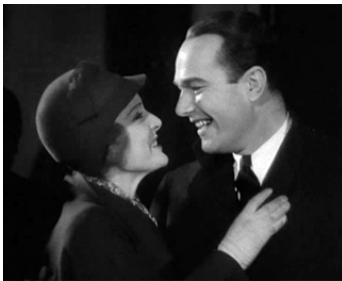
1932 ARE YOU LISTENING ? d'Harry Beaumont avec William Haines