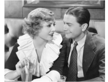
1934 PARIS INTERLUDE (Paris Interlude) d'Edwin L. Marin avec Robert Young