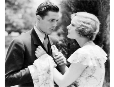
1931 MAINS COUPABLES (Guilty Hands) de W. S. Van Dyke avec William Bakewell