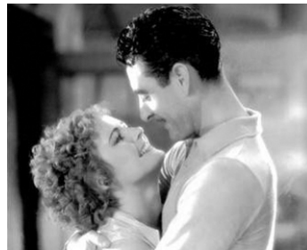
1931 WEST OF BROADWAY d'Harry Beaumont avec John Gilbert