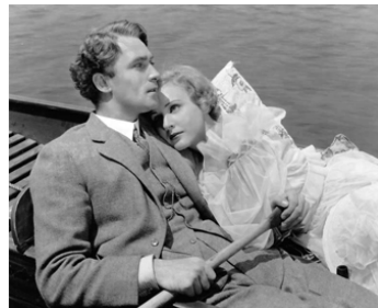
1934 WHAT EVERY WOMAN KNOWS de Gregory La Cava avec Brian Aherne