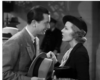
1935 CALM YOURSELF de George B. Seitz avec Robert Young