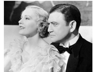
1935 TRANSATLANTIC (The Tunnel) de Maurice Elvey avec Richard Dix