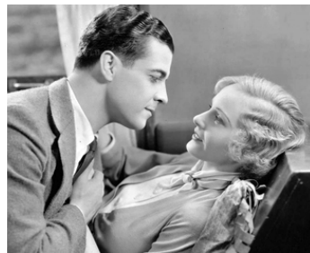
1932 LE BEL ÉTUDIANT (Huddle) de Sam Wood avec Ramon Novarro