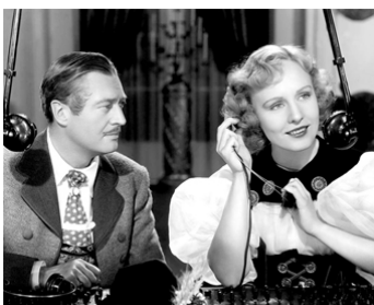
1936 ESPIONNAGE (Espionage) de Kurt Neumann avec Edmund Lowe