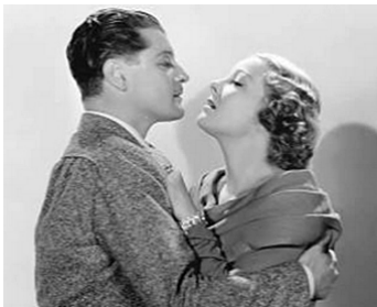
1935 LE TOURNANT DANGEREUX (Age of Indiscretion) d'E. Ludwig avec Ralph Forbes