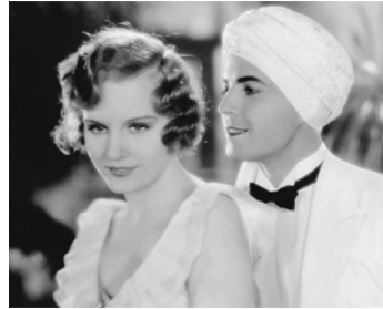
1931 LE FILS DU RAJAH (Son of India) de Jacques Feyder avec Ramon Novarro