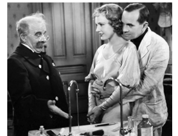
1933 JE SUIS UN VAGABOND (Hallelujah, I'm a bum) de L. Milestone avec Chester Conklin, Al Jolson