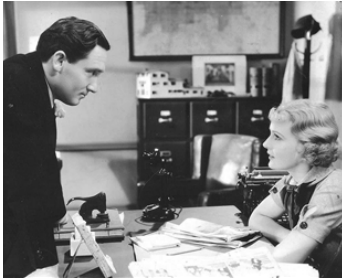
1934 THE SHOW-OFF de Charles Reisner avec Spencer Tracy