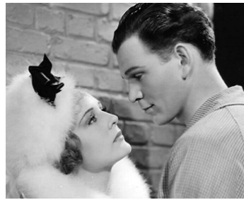
1933 LES PANTINS (Broadway to Hollywood) de Willard Mack avec Russell Hardie