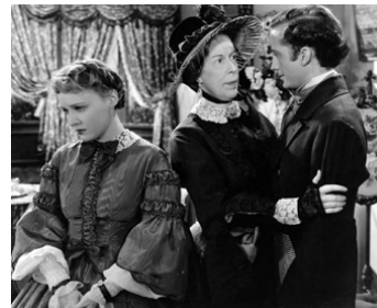
1934 DAVID COPPERFIELD (David Copperfield) de G. Cukor avec Edna May Oliver, F. Lawton