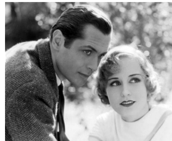
1931 COURAGE (Lovers courageous) de Robert Z. Leonard avec Robert Montgomery