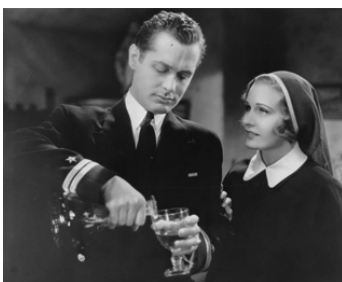
1933 CONFLITS (Hell Below) de Jack Conway avec Robert Montgomery