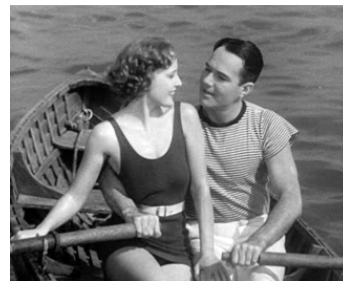
1932 UNE VIE TRÉPIDANTE (Fast Life) d'Harry Pollard avec William Haines