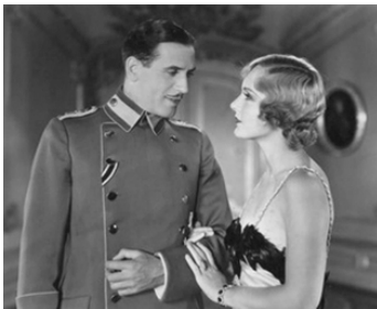
1931 CŒUR BRISÉ (Heartbreak) d'Alfred L. Werker avec Paul Cavanagh