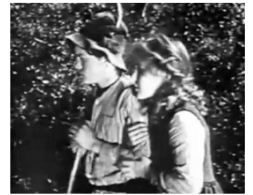
1920 HEIDI (Heidi of the Alps) de Frederick A. Thompson