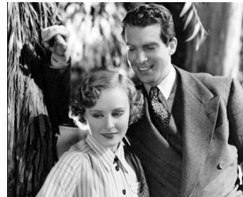
1935 BRIGADE SPÉCIALE (Men without names) de Ralph Murphy avec Fred MacMurray