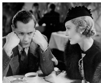
1933 MADE ON BROADWAY d'Harry Beaumont avec Robert Montgomery