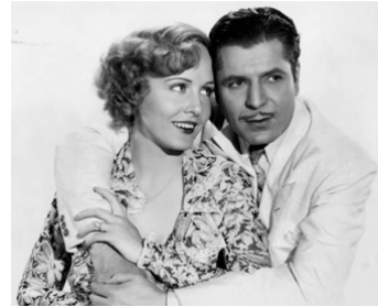
1934 GRAND CANARY d'Irving Cummings avec Warner Baxter