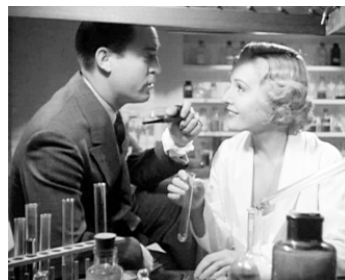
1936 DRAME AU CRÉPUSCULE (Moonlight Murder) d'Edwin L. Marin avec Chester Morris