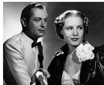
1936 JIM L'EXCENTRIQUE (Piccadilly Jim) de Robert Z. Leonard avec Robert Montgomery