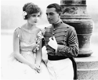
1924 CLASSMATES de John S. Robertson avec Richard Barthelmess