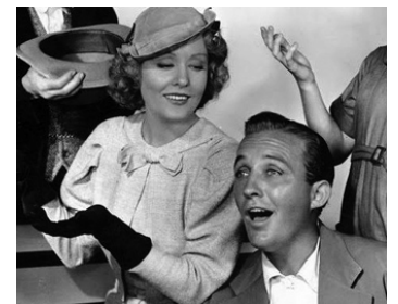
1936 LA CHANSON À DEUX SOUS (Pennies from heaven) de Norman Z. McLeod avec B. Crosby