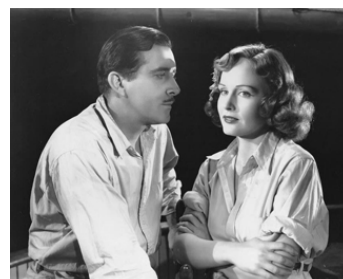
1938 MALFAITEURS AU PARADIS (Sinners in Paradise) de James Whale avec John Boles