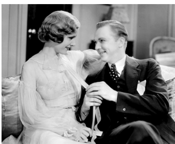
1933 THE NUISANCE de Jack Conway avec Lee Tracy