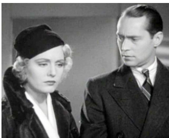
1936 UNE ENQUÊTE SENSATIONNELLE (Exclusive story) de George B. Seitz avec Franchot Tone