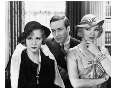
1931 THE GREEKS HAD A WORLD FOR THEM de L. Sherman avec Ina Claire, David Manners